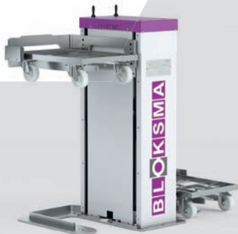
HUBGERÄTE Ergonomisch arbeiten